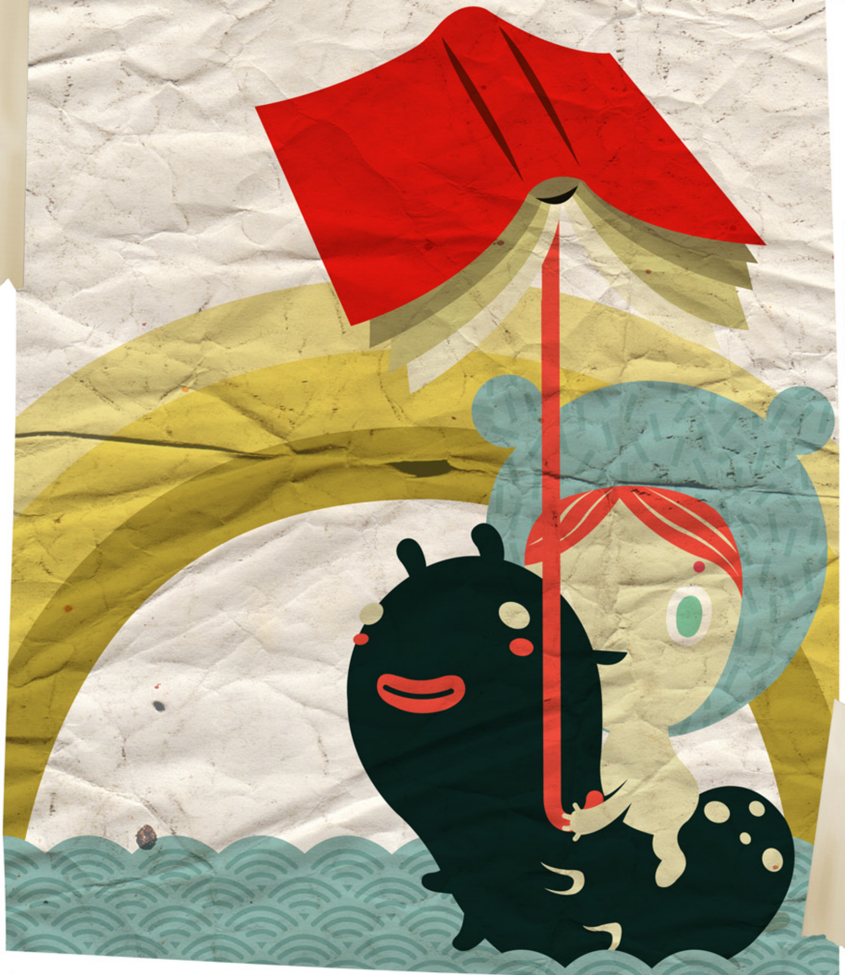
ILUSTRACIÓN Y D.G. ITZEL NÁJERA

INICIO: 26 de octubre de 2011 INSCRIPCIONES a partir del 26 de septiembre